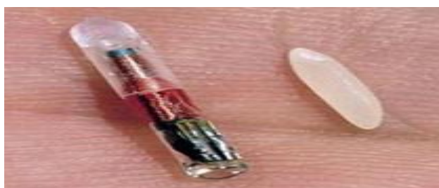
Gambar 3. Microchip untuk Sapi dan Kerbau

Tag RFID (Gambar 2) sangat bervariasi dalam hal bentuk dan ukuran. Sebagian tag mudah ditandai, misalnya. Tag untuk tracking hewan yang ditanam di bawah kulit berukuran tidak lebih besar dari bagian lancip dari ujung pensil. Bahkan ada tag yang lebih kecil lagi yang telah dikembangkan untuk ditanam di dalam serat kertas uang (Gambar 3).