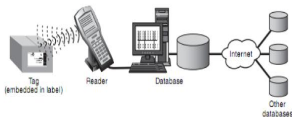
Gambar 1. Basis Data pada Sistem RFID

Chip mikro itu sendiri dapat berukuran sekecil butiran pasir, seukuran 0,4 mm. Chip memiliki nomor seri yang unik atau informasi lainnya tergantung kepada tipe memorinya. Tipe memori itu sendiri dapat read-only , read-write , atau write-once read-many . Antena yang terpasang pada chip mikro mengirimkan informasi dari chip ke reader . Rentang pembacaan biasanya diindikasikan dengan besarnya antena. Antena yang lebih besar mengindikasikan rentang pembacaan yang lebih jauh. Tag tersebut terpasang atau tertanam dalam obyek yang akan diidentifikasi. Tag dapat di- scan dengan reader bergerak maupun stasioner menggunakan gelombang radio.