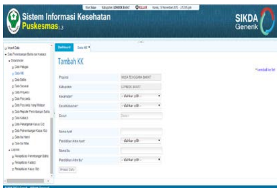
Gambar 6. Form tambah KK

Selanjutnya data dari tiap menu yang ada harus diisi dengan lengkap karena setiap menu saling berhubungan, misalnya contoh mengisi data KK, dengan menggunakan form data KK (gambar 6)