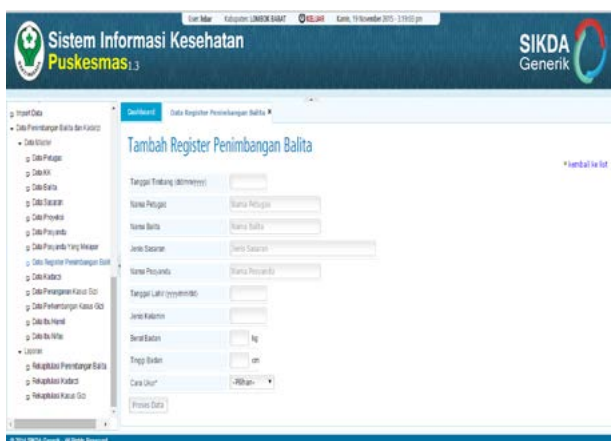
Gambar 7. Form Tambah Register Penimbangan Balita

Selain form tambah KK, juga ada form tambah register penimbangan balita (gambar 7) yang berfungsi untuk menambah data register penimbangan balita yang berisi item data antara lain: tanggal timbang, nama petugas, nama balita, nama posyandu, tanggal lahir, jenis kelamin, berat badan, tinggi badan, dan cara ukur, serta pertanyaan untuk pemberian Asi Eksklusif berdasarkan kelompok umur. dan juga ada form tambah perkembangan kasus gizi yang berfungsi untuk menambah data perkembangan kasus gizi balita sebagaimana terlihat pada gambar 8 berikut ini.