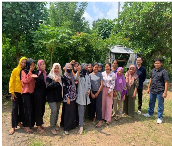
Gambar 2: Foto kegiatan Panitia dan warga

Dengan adanya table rincian kegiatan agar menjadi sebuah analisa memudahkan dalam membaca kegiatan acara serta untuk diberikan kritik serta seran dengan adanya kegiatan pengabdian masyarakat demi untuk kesetaraan gender pendidikan antar perempuan dan laki-laki.