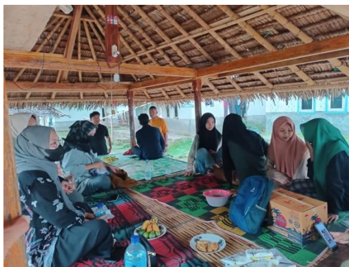
Gambar 3: kegiatan bersama Panitia dan peserta